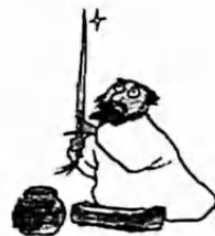
生活会磨平你的棱角,但也会给予你锋芒