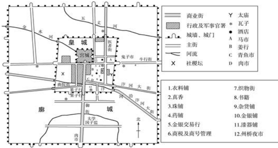
图1 北宋末年东京三重城结构及主要行市分布